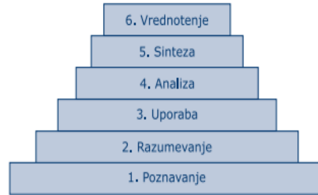
Slika 3.2 Po Bloomu lahko mišljenje razdelimo v šest stopenj naraščajoče kompleksnosti od preprostega priklica dejstev na najnižji ravni do vrednotenja na najvišji.

Po Bloomu je védenje sestavljeno iz šestih zaporednih stopenj, ki tvorijo hierarhijo (slika 3.2).